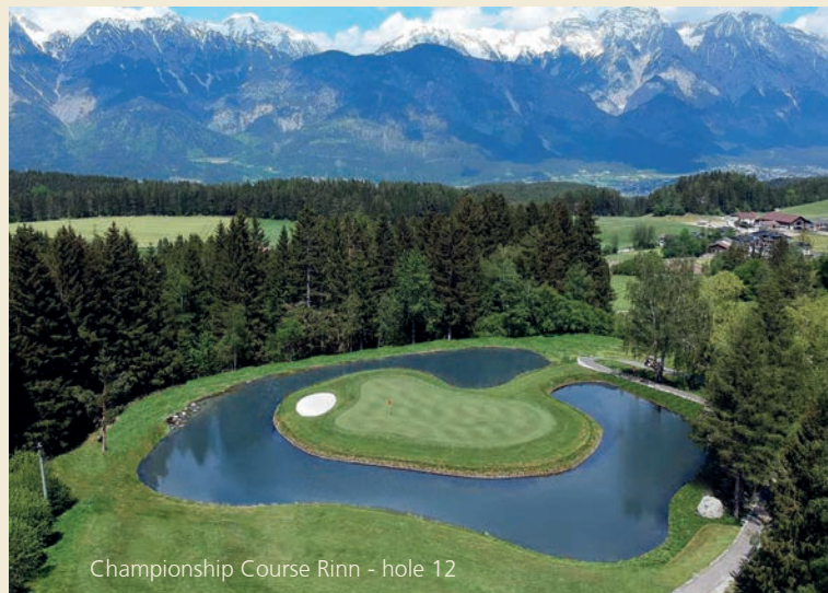
Championship Course Rinn - hole 12

Welcome One Club - Two Courses Willkommen Ein Club - Zwei Plätze