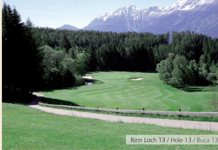
Rinn Loch 13 / Hole 13 / Buca 13

Le 18 buche del Championship-Course Rinn sono disposte sui pendii alpini del monte Glungezer. I 18 percorsi, parzialmente collinari, si estendono sull'altipiano quasi come due cerchi concentrici. Il fascino del luogo cattura non soltanto per la sfida sportiva, ma anche per il panorama mozzafiato. L'occhio corre dai monti Wetterstein fino alle montagne del Wilder Kaiser lasciando impressa un'emozione indelebile. Il ristorante della clubhouse con la sua terrazza panoramica invita a gustare dei piatti prelibati offrendo un paesaggio ideale per un classico „Sundowner“ in stile inglese.