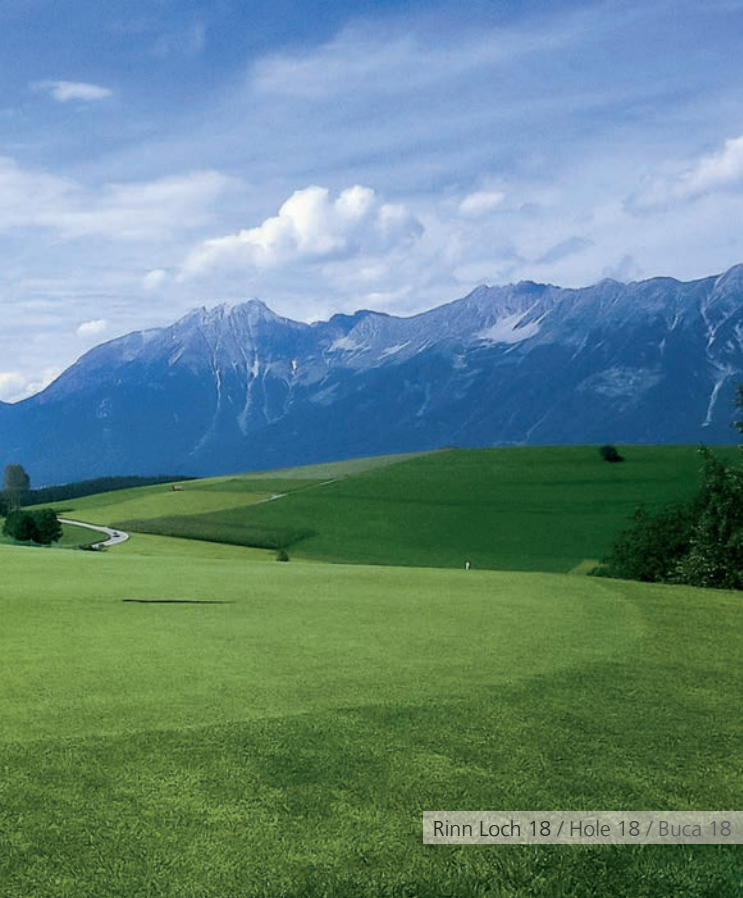
Rinn Loch 18 / Hölle 18 / Buca 18